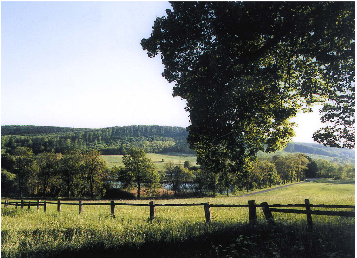
Reizvolle Kulturlandschaft: das Reitlingstal im Naturpark Elm-Lappwald

Folglich beeinflussten Abwanderungen aus dem Grenzgebiet zur DDR und Zuwanderungen nach der Wiedervereinigung die Bevölkerungsstatistik maßgeblich. Die komplexe, räumlich divergierende Entwicklung beruht aber auch auf der Tatsache, dass sich im Landkreis Wolfenbüttel in den letzten Jahrzehnten eine für Großstadtrandkreise typische Veränderung vollzogen hat. Angesichts rückläufiger landwirtschaftlicher und industrieller Beschäftigtenzahlen und des geringen Eigenbesatzes an gewerblichen Arbeitsstätten nahm die Ausrichtung auf benachbarte gewerbliche Zentren zu. Dadurch stieg das Pendleraufkommen stetig an, die Pendlerströme wuchsen auch durch den Zuzug von Menschen, die in einer Großstadt wie Braunschweig beschäftigt sind. Die Stadtrandgemeinden Wolfenbüttel und Cremlingen haben so durch neue Wohnsiedlungen einen beachtli-